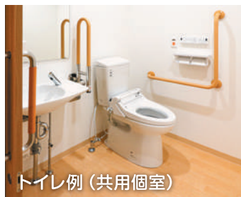
トイレ例 (共用個室)